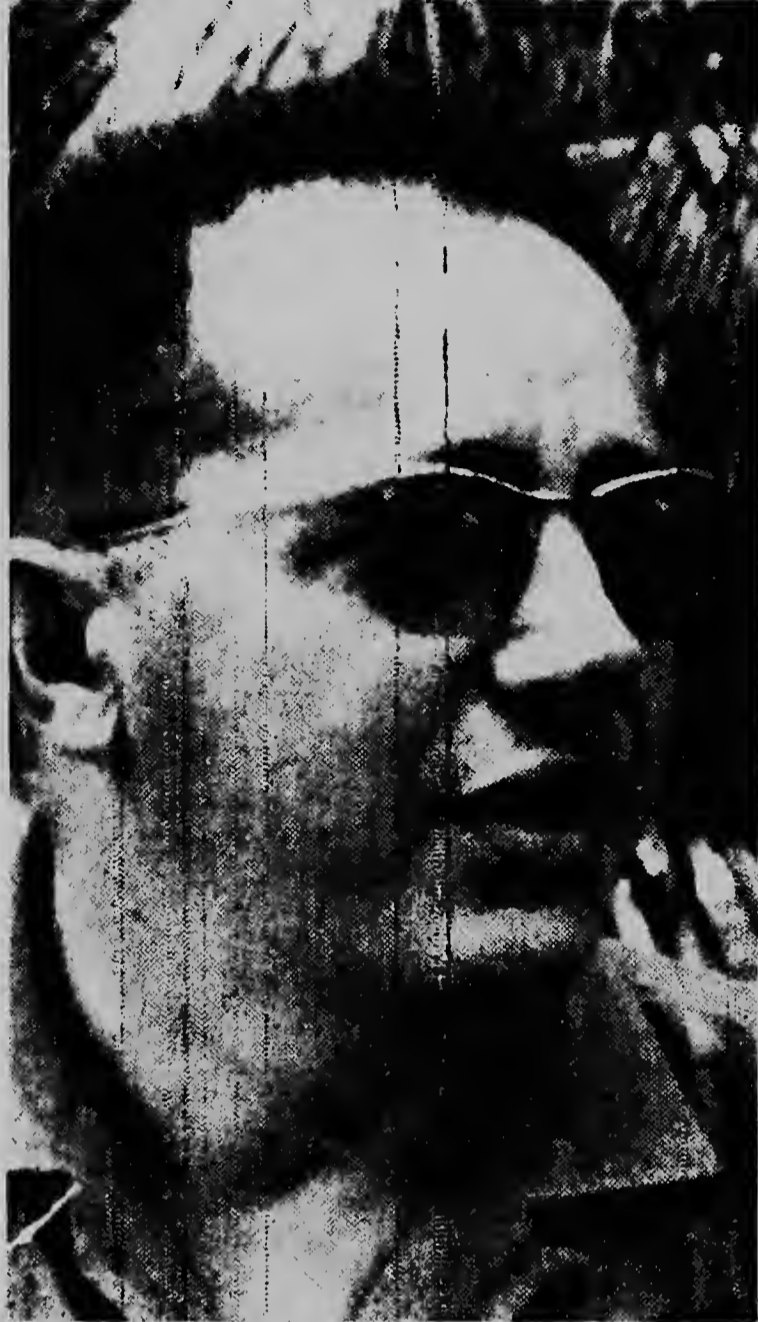
Bernard B. Fall, autor di varios boekie riba Vietnam y estudiante profundo di historia di Vietnam, a cai den un trampa di Vietcong e siman aki y a muri inmediatamente, mientras cu e tabata compafiando un unidad militar norteamericano, cu tabata patruyando. Fall, di 41 anja di edad, tabata un Frances cu ta biba na Merca.